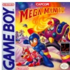
Mega Man IV