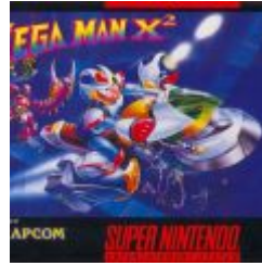
Mega Man X 2