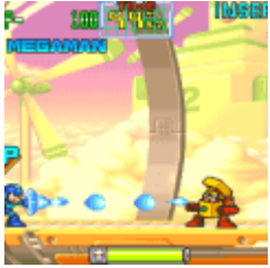
Mega Man: The Power Battle