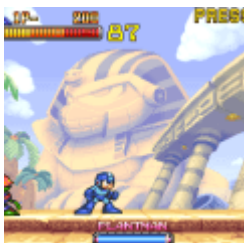
Mega Man 2: The Power Fighters