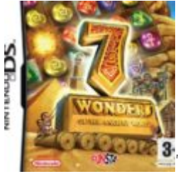
7 Wonders of the Ancient World