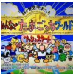
64 de Hakken!! Tamagotchi - Minna de Tamagotchi World