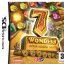
7 Wonders of the Ancient World