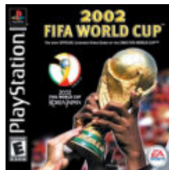
FIFA World Cup 2002