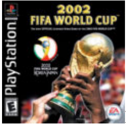
FIFA World Cup 2002