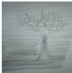
Ins Land der