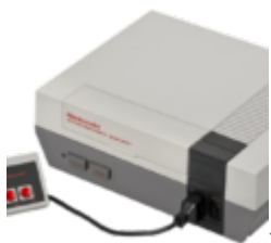
Nintendo Entertainment System