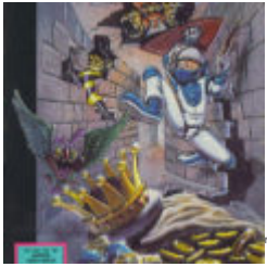
The Adventures of Captain Comic