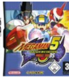
Mega Man Battle Network 5: Double