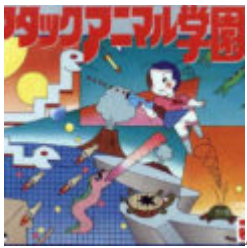
Attack Animal Gakuen