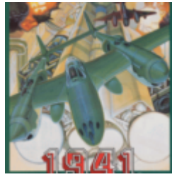
1941: Counter Attack