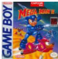
Mega Man II