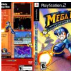
und Publisher II