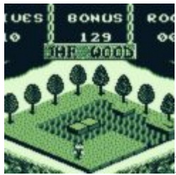
Die Abenteuer von Pinocchio Beta