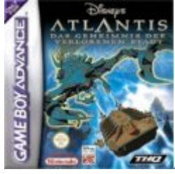
Atlantis: Das Geheimnis der verlorenen Stadt