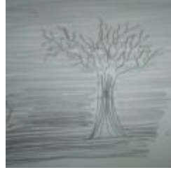
Ins Land der Dämonen