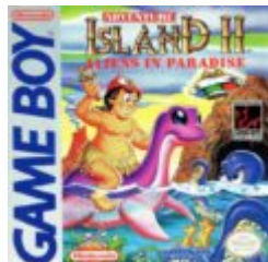
Adventure Island II: Aliens in Paradise