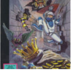
The Adventures of Captain Comic