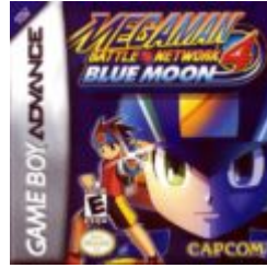
Mega Man Battle Network 4: