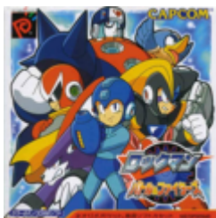
Rockman Battle & Fighters