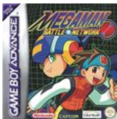
Mega Man: Battle Network