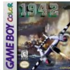
1942 - First