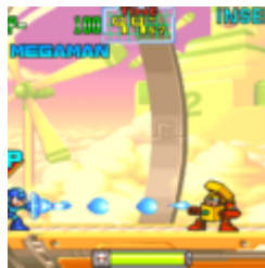
Mega Man: The Power Battle