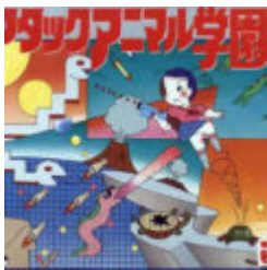
Attack Animal Gakuen