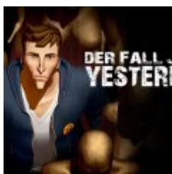
Der Fall John Yesterday