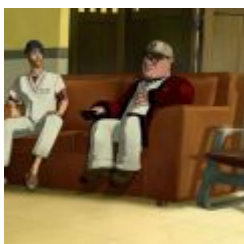
Runaway 3 - A Twist of Fate