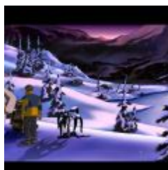
Runaway 2 - The Dream of the