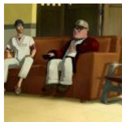
Runaway 3 - A Twist of Fate