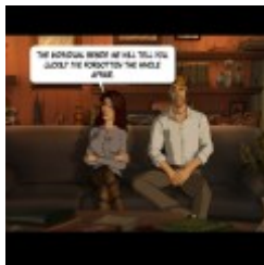
Dream of the turtle