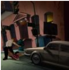
Runaway - A Road Adventure - Abgedrehter Rätselspaß