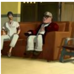
Runaway 3 - A Twist of Fate