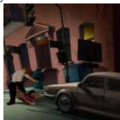
Basco und Gina Timmins