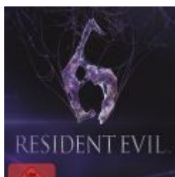
Resident Evil 6