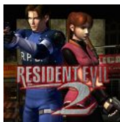
Resident Evil 2