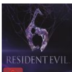
Resident Evil 6