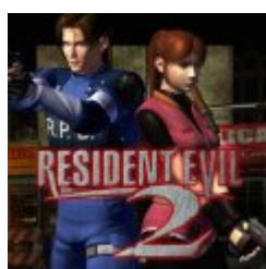
Resident Evil 2