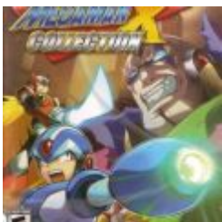
Mega Man X Collection