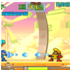
Mega Man: The Power Battle