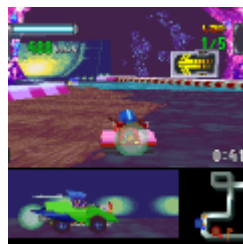
Mega Man Battle & Chase