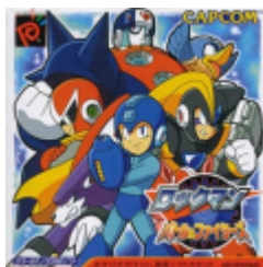
Rockman Battle & Fighters