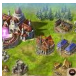
Lord of Ultima