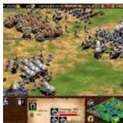
Age of Empires 2: Age of Kings