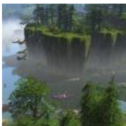
Age of Empires 3