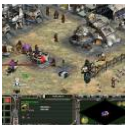
Star Wars - Galactic Battlegrounds